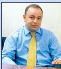
Швидлер Евгений Маркович Президент, председатель Правления

За отчетный период (2002 г.) проведено 7 заседаний Правления. В соответствии со своей компетенцией Правление принимало решения о совершении сделок, размер которых составляет от 10 % до 25 % балансовой стоимости активов Компании. Правлением были утверждены плановые показатели основной деятельности Компании, рассмотрен вопрос выплаты вознаграждения работникам Компании по итогам 2002 года.