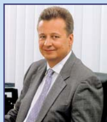
Корсик Александр Леонидович Первый вице-президент